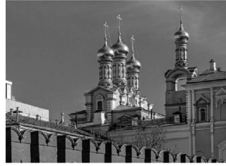
Kreml, Moskva.